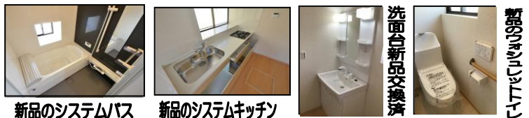
新品のシステムバス 新品のシステムキッチン 洗面化粧台新品交換済

※上記支払は1,799万円借入、35年返済、変動金利1.00%（優遇）より算出。 ※年齢・収入・勤務状況等により条件が変わる場合があります。 詳しくは営業担当からご説明させていただきます。